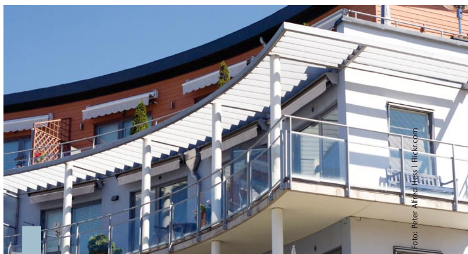
Hohe Preisforderungen in den Metropolen veranlassen Immobilienkäufer und -anleger dazu, ihr Interesse verstärkt auf B-Standorte und Stadtrandlagen zu richten.

Die Kapriolen der Finanzmärkte wirken sich auf den Immobilienmarkt nur geringfügig aus – und Einflüsse aus dem Ausland sind in diesem Bereich kaum spürbar. Dagegen bewirkt der Konjunkturaufschwung in Deutschland, dass mehr investiert, mehr gebaut und mehr saniert wird, denn Immobilien gelten zu Recht als sicher. Der Angebotspreisindex IMX von ImmobilienScout24, welcher aus über zehn Millionen Immobilienangeboten ermittelt wird, zeigt: Die Angebotspreise sowohl für Bestands- als auch für Neubaumobilien sind im vergangenen Vierteljahr gestiegen. Allerdings scheint das Wachstum weniger in den Top-Standorten der Metropolen stattzufinden: Hier halten die Preise ihr Niveau. Vielmehr sind zunehmend B-Standorte und Stadtrandlagen gefragt. Die Käufer weichen offenbar auf günstigere Objekte am Stadtrand aus. Im Bundesdurchschnitt ist der Angebotspreis für Neubauwohnungen zwischen Juni 2010 und Juni 2011 um 5,8 Prozent gestiegen, für Bestandswohnungen um 2,9 Prozent. Bei neu gebauten Wohnhäusern stieg der Angebotspreis um 4,2 Prozent, bei Bestandshäusern um 2,2 Prozent.